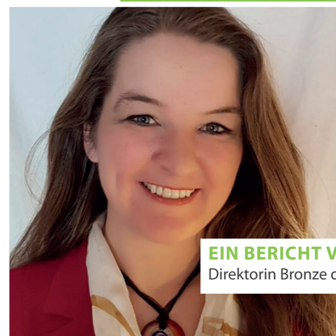
EIN BERICHT VON CLAUDIA RIEGER, Direktorin Bronze des Teams Hall of Fame